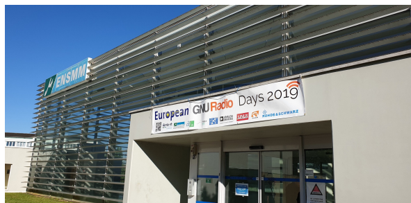
Figure 2: L'École Supérieure de Mécatronique et des Microtechniques (ENSMM) de Besançon a accueilli les deuxièmes GNU Radio Days pour réunir les utilisateurs et développeurs de GNU Radio.