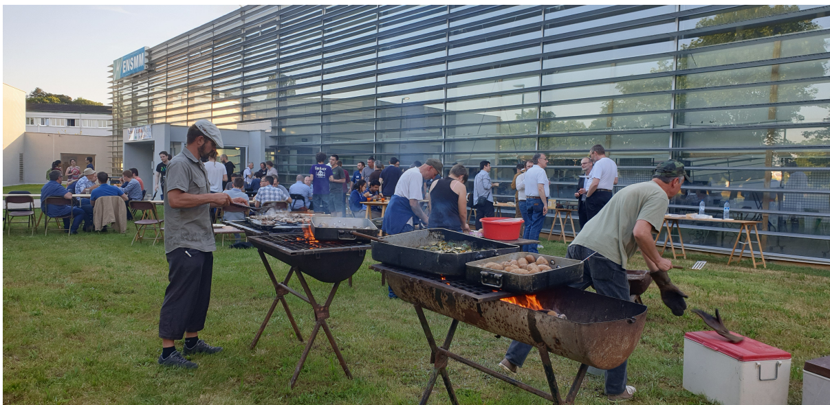
FIGURE 7 – Soirée conviviale autour d'un barbecue arrosée par le brasseur CUC.