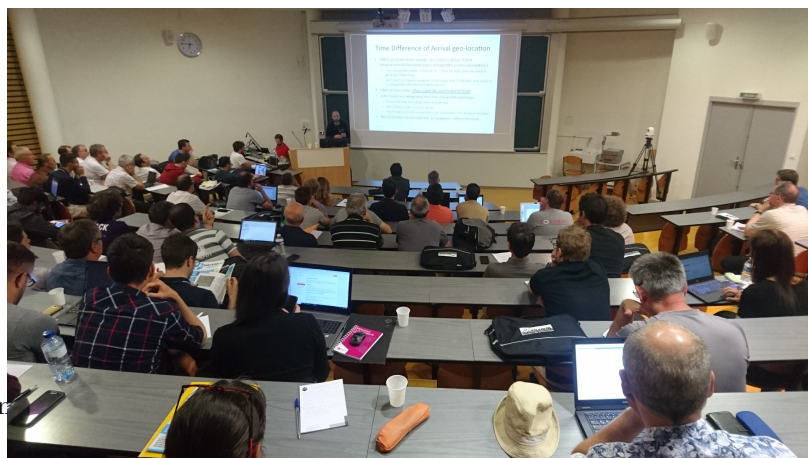
Figure 3: La KiwiSDR permet la datation sur référence GPS des trames acquises par les récepteurs distribués dans le monde (note : aucun rapport avec l'émetteur Kiwi du CNES conçu pour Planète Science!).

Parmi les points remarquables abordés sur le premier sujet, après une présentation sur le suivi de trajectoires de projectiles balistiques (?!) par un réseau d'antennes et la réception de signaux satellites par le réseau SATNOGS, nous avons découvert KiwiSDR (Fig. 3) qui semble tout a fait passionnant pas sa capacité à dater les trames sur un signal de synchronisation global (1 PPS) du GPS. Cette fonctionnalité répond à un besoin qui a souvent fait défaut lors du traitement de signaux acquis par websdr dont l'absence de marqueur de syn-