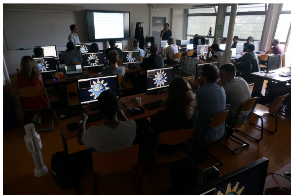
FIGURE 5 – Tutorial d'analyse du spectre radiofréquence dans une salle informatique de l'ENSMCM qui n'avait pas vu autant de pingouins depuis longtemps.