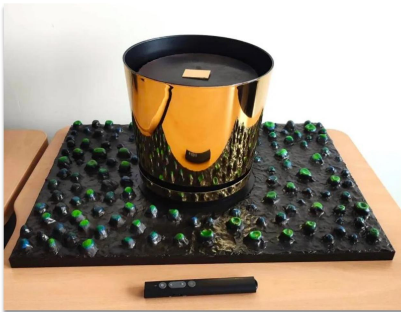
Figure 6: Nano-vibrations (© Installation interactive, création avec les étudiants de Femto-St)

Cette série se situe ainsi à la croisée de plusieurs régimes de valeur : scientifique, esthétique, anthropologique et politique. En intégrant des biopuces réelles à des objets de parure, elle déplace les frontières entre outil et ornement, entre laboratoire et corps, entre invisible scientifique et visibilité sociale. Le bijou ne fonctionne plus uniquement comme signe décoratif ou identitaire ; il devient un médium de transmission des imaginaires de la recherche contemporaine et une interface entre le vivant, la technologie et l'expérience humaine.