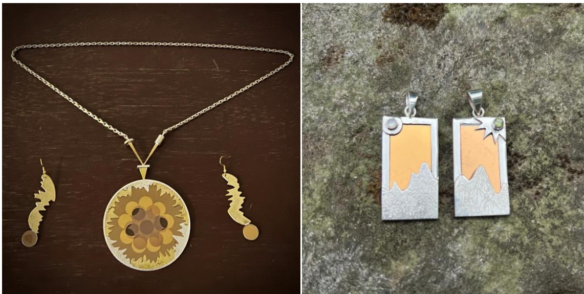
Figure 5: Bijoux biopuces ( © Série de bijoux en argent, or nordique et biopuces d'or)

Le choix du marbre, de la disposition des instruments et des dorures confère à l'expérience scientifique une dimension monumentale, figeant les composants de laboratoire, habituellement associés à la manipulation, dans la structure familière de l'urbain. En plaçant les outils mêmes de la recherche sur un piédestal, Adèle Tilouine propose une réflexion sur l'importance des gestes ordinaires et des outils de base dans la connaissance scientifique.