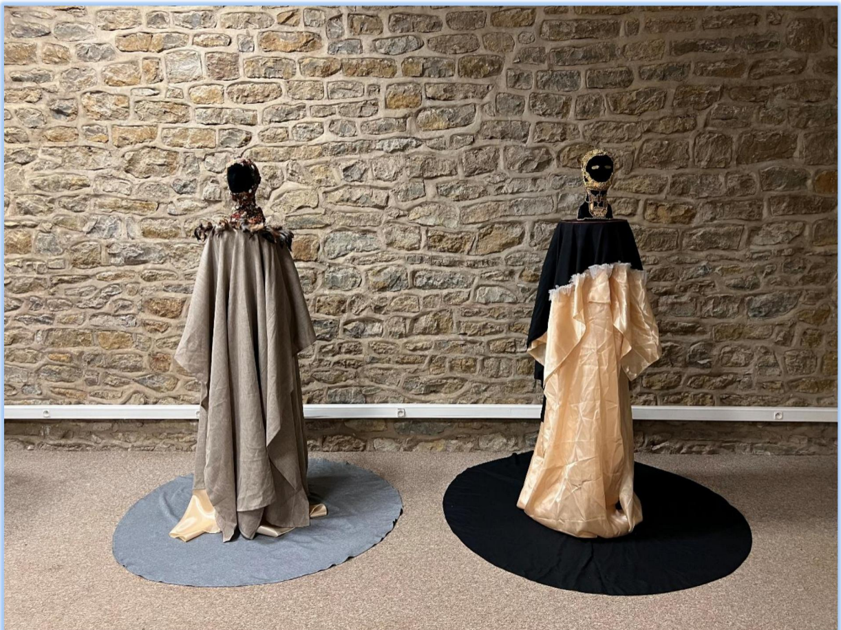
Figure 7: Dialogue (© Installation, crédit photo : A. Tilouine)

scientifique vers une réflexion plus large sur les liens entre technologie, vivant et identité corporelle. L'installation révèle également que la recherche contemporaine ne se réduit pas à une production de données ou d'innovations techniques : elle engage des imaginaires, des gestes, des projections thérapeutiques et des manières nouvelles de penser la place de l'humain au sein de la matière qu'il étudie et transforme.