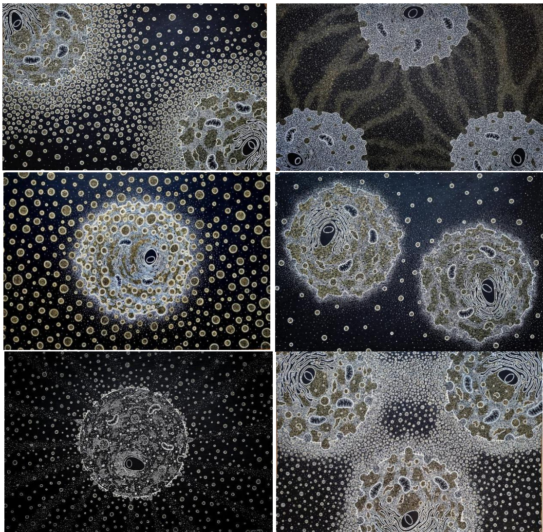
Figure 1: Nano-Univers (© Dessin sur papier népalais poli à la pierre noire)

nanométrique : transposition cosmique, analogie paysagère ou cartographie topographique. Cette approche ne vise pas à illustrer les nanosciences de manière didactique, mais à interroger les visualisations de l'invisible. Les œuvres analysées dans ce chapitre démontrent que les images scientifiques sont des constructions culturelles et intellectuelles, dont l'interprétation peut être prolongée, déplacée ou enrichie par l'interprétation artistique.